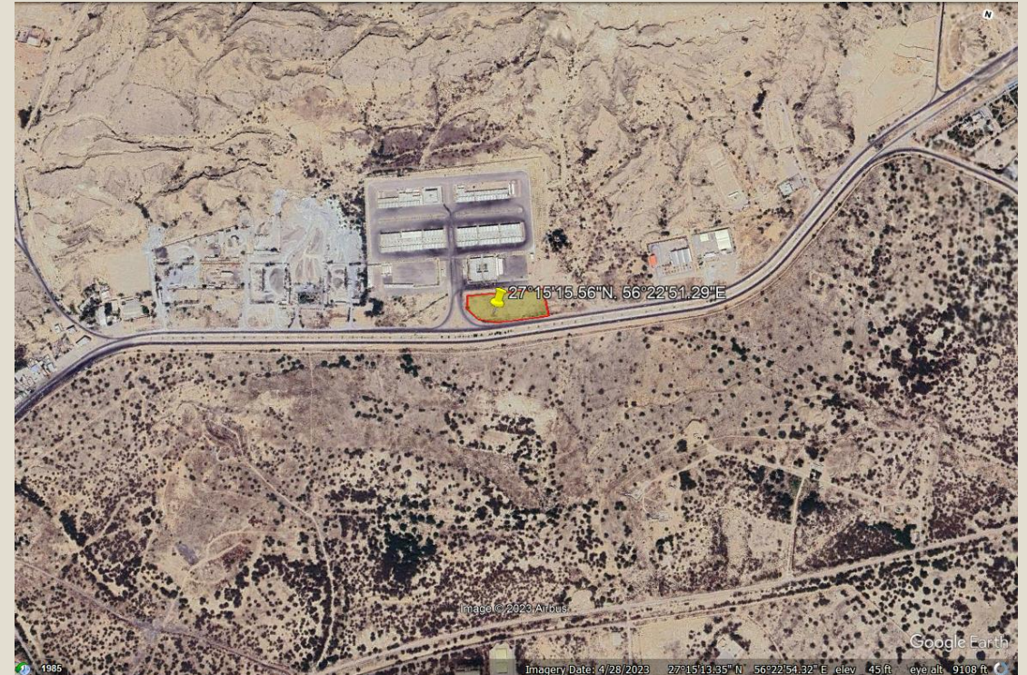
ورودی شرقی (میناب) مساحت: ۱.۶ هکتار