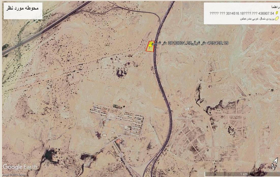
ورودی غربی (شهید راه آهن) مساحت: ۷۲۴۴ مترمربع