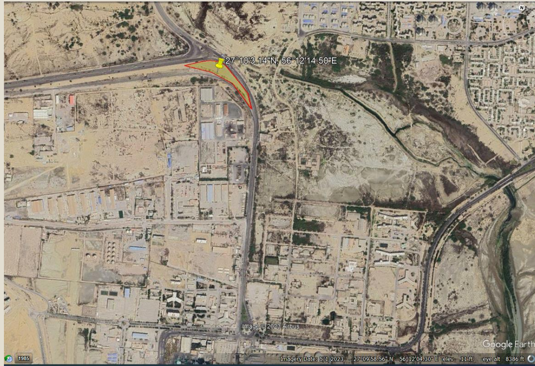
ورودی غربی (اسکله باهنر) مساحت: ۱.۰۶ هکتار